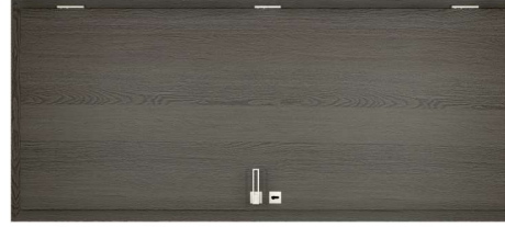
Antracit Tölgy B637