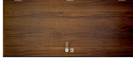
Klasszikus Dió B597