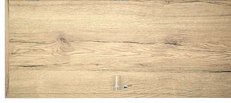
Natúr Tölgy B587